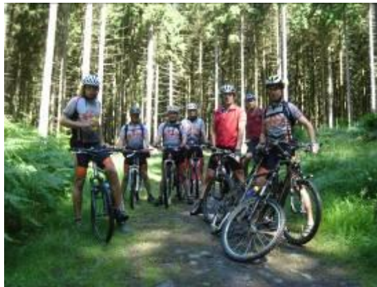
Uitstap Vlaamse Ardennen